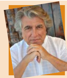
Jordi Sierra i Fabra

Puede motivar la lectura de esta historia viendo el trailer de la película Matilda (duración: 3 minutos). Dialogue con los estudiantes sobre el comportamiento de los padres, del hermano y de Matilda. Pregunte, por ejemplo, si también les gusta leer libros. Luego pueden realizar una lluvia de ideas sobre la importancia de la lectura. Mencione, finalmente, que nuestro personaje principal es un niño al que también le gusta leer.