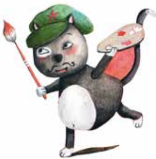
Donato, el gato

1. Identifica con qué personaje se encuentra primero Amanda y marca con un aspa (X).