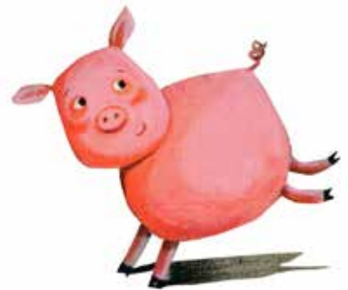
Laureano, el marrano

2. Recuerda y responde las siguientes preguntas sobre Amanda.