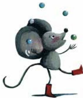
Fiona, la ratona